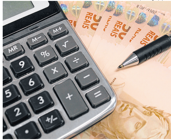
Maioria dos consumidores ainda pensa que cuidar das finanças é tarefa difícil