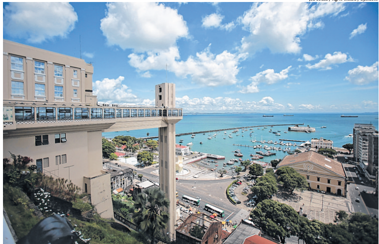
A cidade de Salvador, onde é ambientada a novela Segundo Sol, vem liderando buscas entre destinos turísticos

Além da capital, outros destinos turísticos do estado também já serviram de locação