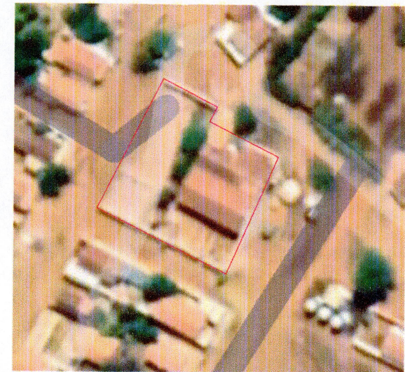
IMAGEM GOOGLE MAPS