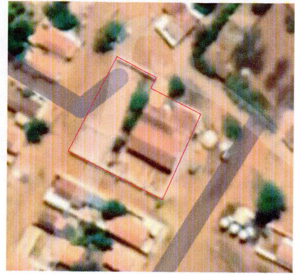
IMAGEM GOOGLE MAPS