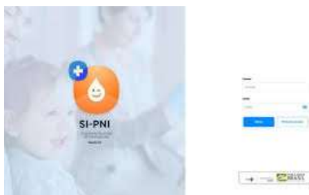
Imagem sipni para registro da vacina covid 19

Os serviços de vacinação públicos e privados que utilizam sistemas de informação próprios deverão fazer a transferência dos dados de vacinação contra Covid-19 para base nacional de imunização, por meio de Webservice do SIPNI/RNDS, conforme o modelo de dados disponibilizado e as orientações do Ministério da Saúde. O município participou do treinamento e cadastro dos usuários no sistema.