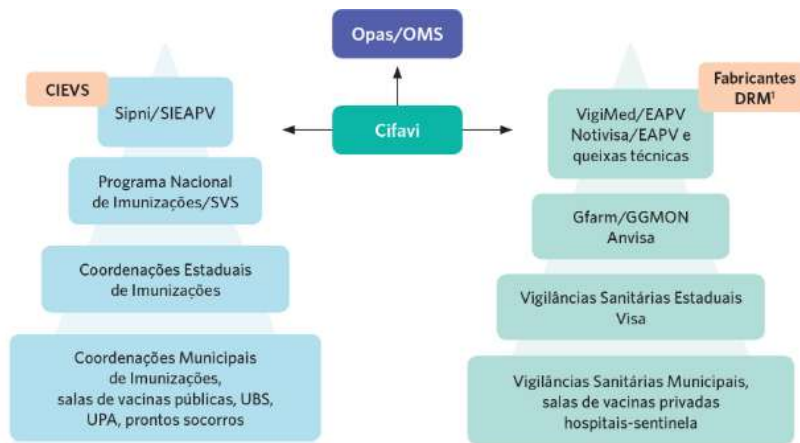
DRM - Detentores de Registro de Medicamentos

Os eventos adversos graves (EAG) deverão ser comunicados pelos profissionais de saúde dentro das primeiras 24 horas de sua ocorrência, do nível local até o nacional seguindo o fluxo determinado pelo Sistema Nacional de Vigilância de Eventos Adversos Pós-Vacinação - SNVEAPV , conforme Figura a seguir: