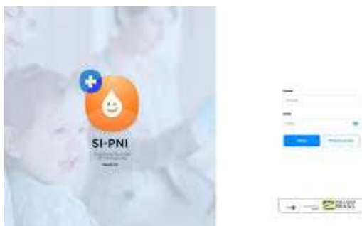
Imagem sipni para registro da vacina covid 19

Os serviços de vacinação públicos e privados que utilizam sistemas de informação próprios deverão fazer a transferência dos dados de vacinação contra Covid-19 para base nacional de imunização, por meio de Webservice do SIPNI/RNDS, conforme o modelo de dados disponibilizado e as orientações do Ministério da Saúde. O município participou do treinamento e cadastro dos usuários no sistema.