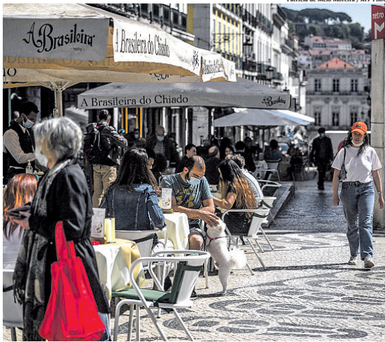
Pessoas voltaram a ocupar ontem mesas em cafés no bairro do Chiado, em Lisboa