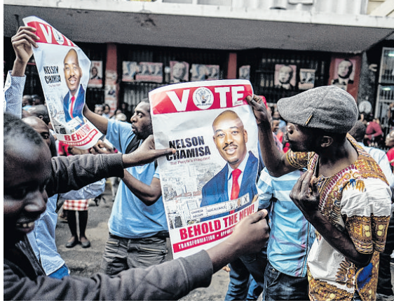
Presidente deposto negou o voto ao seu antigo partido e indicou voto em Chamisa

O líder da oposição, Nelson Chamisa, afirmou na manhã de ontem que está caminhando rumo à vitória "de maneira incontestável". Seus apoiadores se junta-