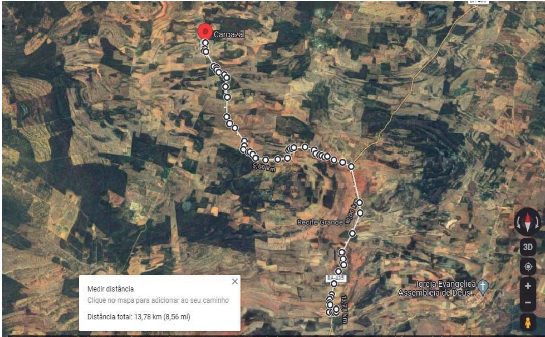
ROTA CAROAZAL - GAMELEIRA

ESTADO DA BAHIA Prefeitura Municipal de São Gabriel CNPJ (MF) 13.891.544/0001-32