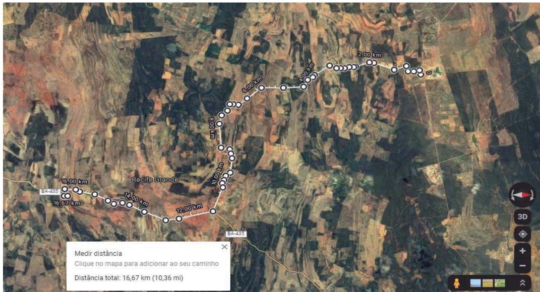
ROTA NOVA ESPLANADA - GAMELEIRA