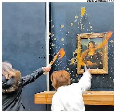
Museu do Louvre: imagens mostram ação de ativistas

As duas mulheres participaram do grupo ativista francês 'Riposte Alimentaire' (Resposta Alimentar) e foram retiradas do local por seguranças.