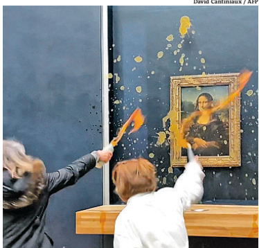
Museu do Louvre: imagens mostram ação de ativistas

As duas mulheres participam do grupo ativista francês "Riposte Alimentaire" (Resposta Alimentar) e foram retiradas do local por segurança.