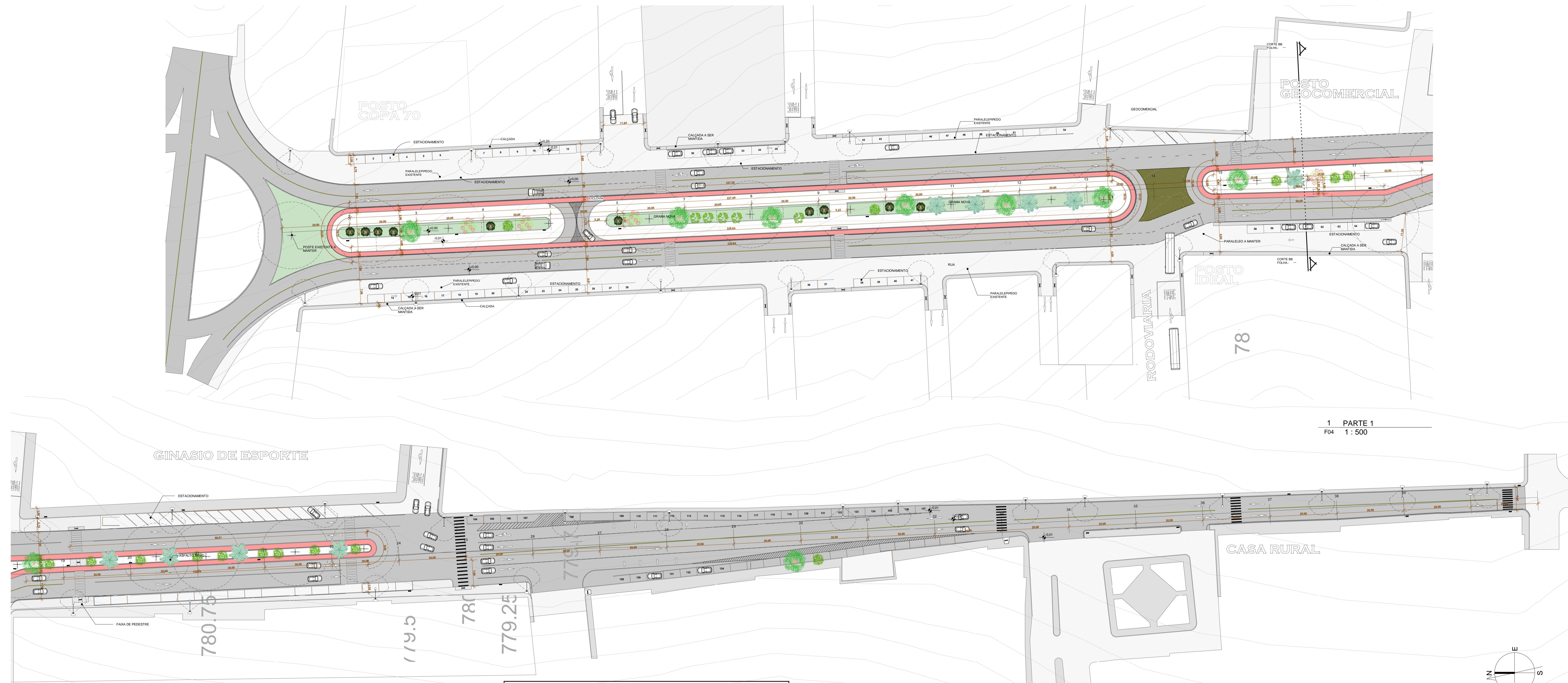
1 PARTE 1 F04 1 : 500