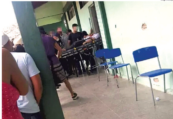
Aluno de 15 anos entrou na escola com arma escondida sob o fardamento escolar

Um estudante está entubado, em estado grave, e outro está estável. Outro baleado na perna