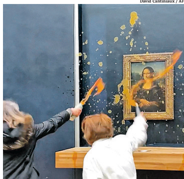
Museu do Louvre: imagens mostram ação de ativistas

As duas mulheres participam do grupo ativista francês "Riposte Alimentaire" (Resposta Alimentar) e foram retiradas do local por seguranças.