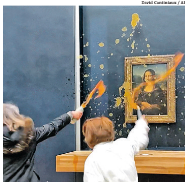
Museu do Louvre: imagens mostram ação de ativistas

ria, para trabalhar no combate ao Estado Islâmico. Ele também culpou as "milícias apoiadas pelo Irã" e reiterou o comentário do presidente Biden de que os EUA responderiam no momento e local escolhido. O ataque Ostrés soldados americanos morreram ontem, em um ataque com drones contra uma base dos Estados Unidos na Jordânia. O Exército anunciou que pela primeira vez integrantes das Forças Armadas do país faleceram em consequência de fogo hostil desde o início da guerra Israel-Hamas.