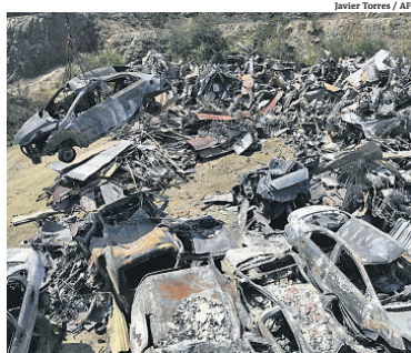
Fogo deixou um rastro de casas e carros queimados