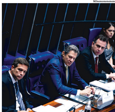
Campos Neto, Haddad e Pacheco no Senado Federal