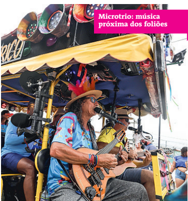
Microtrio: música próxima dos foliões

A programação seguiu por todo o dia, encerrando a maratona carnavalesca. E para quem já está saudoso, hoje tem "arrastão", com trio, às 10h, no Circuito Maneca Ferreira.