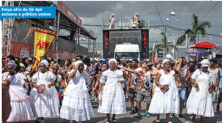
Força afro do Ilê Ayê animou o público ontem