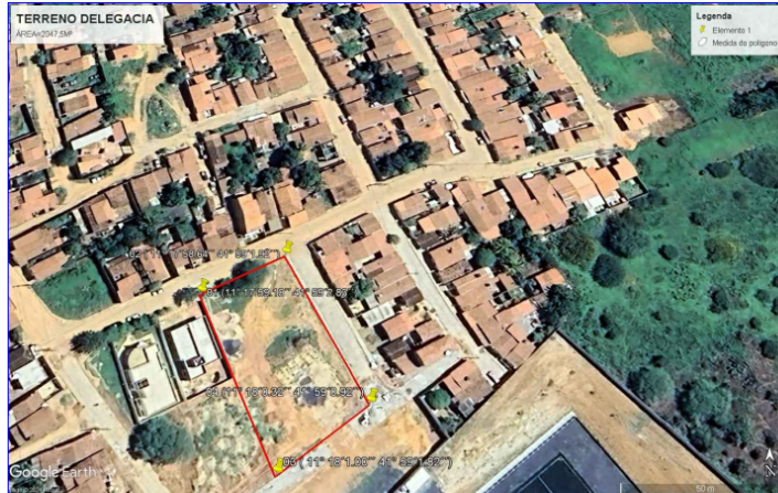
PLANTA DE SITUAÇÃO