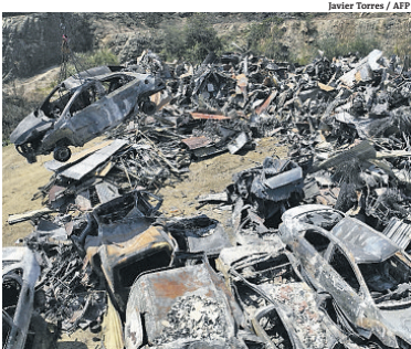
Fogo deixou um rastro de casas e carros queimados